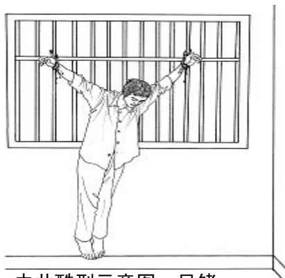
中共酷刑示意图：吊铐

若手一下落，手铐会越勒越紧，时间久了，手铐已卡在骨头上了，血顺着手臂淌下来，疼痛难忍。