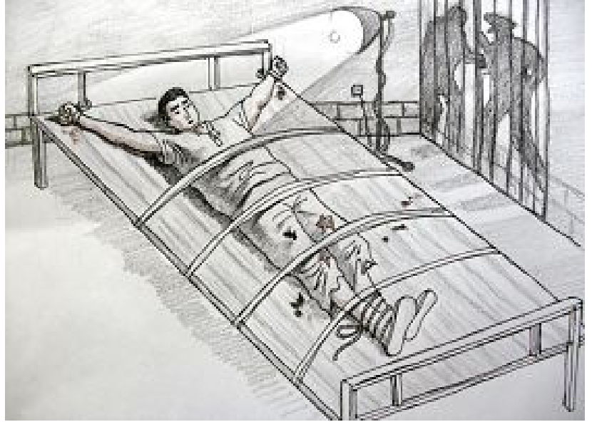
中共酷刑示意图：长期铐在床上并强光照射

据明慧网资料，都匀监狱狱警用残酷手段折磨、摧残法轮功学员，包括死人床、关禁闭、坐独凳、毒打、罚跪、电击、开水烫、烟头烧、用强灯烘烤双眼、冻刑、使用车轮战术长达几十天不让睡觉、不许大小便、暴力灌食、逼听逼看诽谤大法的录音录像、超负荷奴役劳动、在食物中掺入毒药，等等等等。恶警们甚至为各自取得转化法轮功学员的“功绩”而相