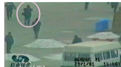
▲圈中的男子，在军警间从容拍摄。

自焚事件后，一位电视台的朋友说：“自焚一定是政府演的戏。记者上天安门都要事先申请采访内容，审批是很严的，我们扛摄像机上天安门要是没有许可证，当时就被轰走。这回自焚前后就一两分钟，拍了个正着，连采访话筒都是准备好的，一看就是导演好的。”