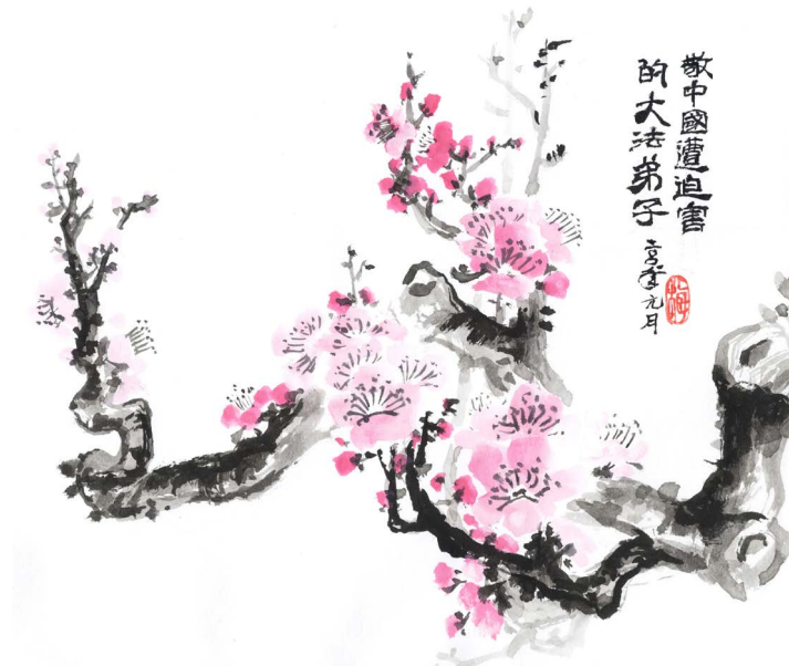
绘画：钢筋铁骨 作者：加拿大法轮功学员