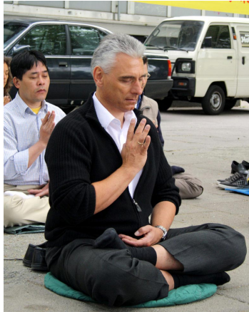
德国高级警督卡斯滕