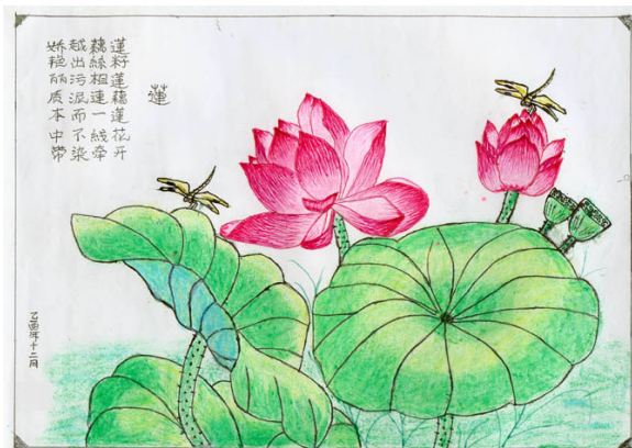
被非法关押在监狱中的辽宁大法弟子绘画《莲》进包厢。

这种现象在江泽民在位那几年最严重。单位之间正常的业务来往、工程建设承包、乃至与镇、村联系工作、单位打民事官司与地方法庭工作人员接触都要吃饭、打牌、跳舞、