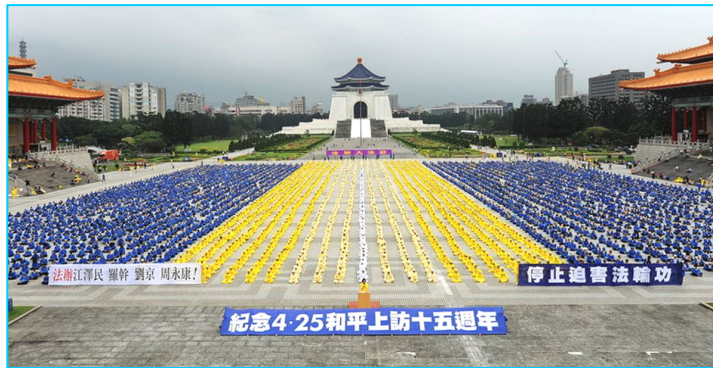
图：2014 年 4 月 26 日台湾纪念“4·25”和平上訪十五周年。

2004 年我开了一家小公司，自己当了老板，有了钱，又有时间，深深陷在名利情中，慢慢地什么病都来了：胃病、肩周炎、痔疮、前列腺炎、乙肝小三阳、失眠，偶而还突然会间歇性一只眼突然看不到。2010 年 5 月份，我又得了皮肤病，这个病虽不是绝症，但医生说病毒潜伏在神经里面，只能吃药控制，不能根治，一个月看病吃药要花好几千元。