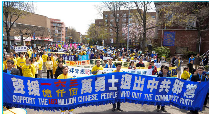
图：2014 年 4 月 26 日纽约声援 1.63 亿中国人“三退”。

2004 年 11 月大纪元发表《九评共产党》，将中共这个“西来幽灵”从起家到现今，以历史事实的角度，彻底剖析了其“假恶暴”以及反人类、反宇宙的邪恶本质。指出中共邪党是目前中国社会一切苦难和罪恶的根源，彻底地打开了禁锢中国人几十年的邪党文化的思想枷锁，引发了席卷中华大地的“三退”大潮。