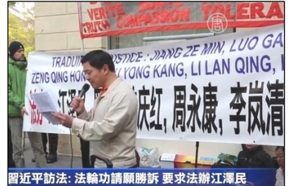
巴黎中使馆前，呼吁法办迫害元凶江泽民及其同伙。