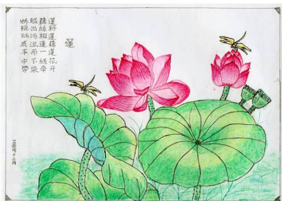
被非法关押在监狱中的辽宁大法弟子绘画《莲》进包厢。

这种现象在江泽民在位那几年最严重。单位之间正常的业务来往、工程建设承包、乃至与镇、村联系工作、单位打民事官司与地方法庭工作人员接触都要吃饭、打牌、跳舞、