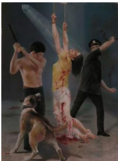
酷刑演示：悬空抽打

2009 年 3 月份，我经人介绍到上海打工。谁知干了 3 个月，老板不给工资，还派人打我。我在被逼无奈的情况下，自卫还击，后来死里逃生，连夜从上海回家。第二天上海警察打电话说：“你的工资给你解决了，你到上海来拿工资。”结果一到上海，警察就把我关进了普陀看守所。我问警察：“你们不是叫我来拿工资的吗？”警察说：“你把你老板叫来呀。”我说：“你们把我关起来我咋叫老板来？”关了一个月后，我妈给上海警察送了 5 千元才放我出来。出来后我去找我老板，把老板带到警察那里，警察什么话都没有说，当着我的面，