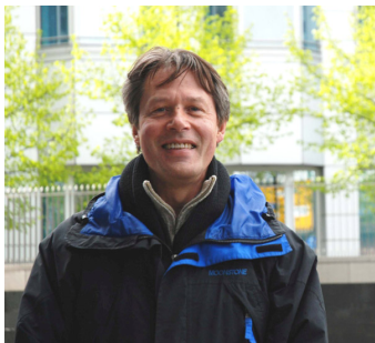
▲法兰兹；▶柏林法轮功学员常年坚持在亚诺维兹桥上演示功法，发真相传单