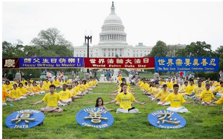
▲美国大华府地区法轮功学员庆祝大法日国会山前集体炼功

我连忙装好《转法轮》赶到医院，给三妹夫念《转法轮》第一讲。第一讲才念完，一直说话吃力且根本动不了的三妹夫就说：“我要翻身！”还要求要对着我念书这一边，给他翻过来后，他对我说：“姐，我要自己看！”我就把书给他放好，