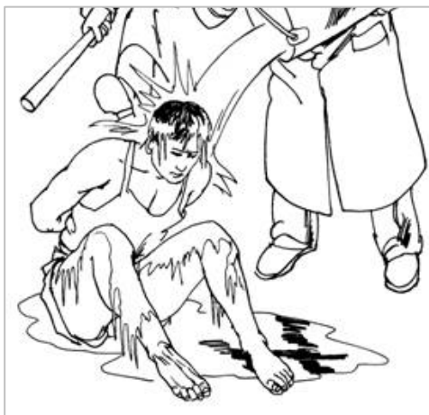
▲ 中共酷刑图示: 浇冷水

由于张杰女士被迫害的身体虚弱,所以从进监狱就一直关在沈阳马三家监区医院。二零一四年大年初八,张杰家属突然接到监狱的电话说:快去,张杰因绝食有生命危险。当家属赶到时,看到张杰是被三个犯