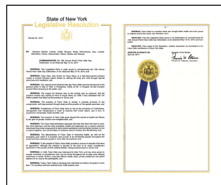
纽约州立法决议案

鉴于，法轮大法自 1996 年传入纽约，数以百计的修炼者在大纽约地区的老人中心、公司、健身房、私人住家和警察局等地举办过多个免费