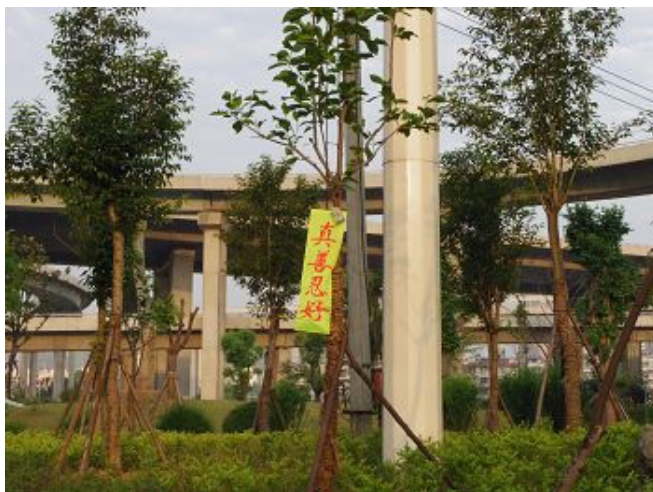
五月十三日武汉市悬挂的真相条幅