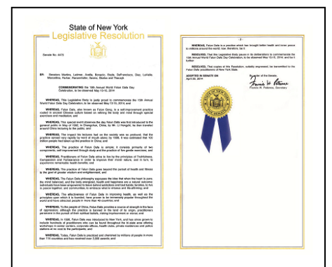
纽约州立法决议案

鉴于，法轮大法自 1996 年传入纽约，数以百计的修炼者在大纽约地区的老人中心、公司、健身房、私人住家和警察局等地举办过多个免费