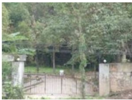
贵阳市烂泥沟洗脑班

烂泥沟洗脑班采取各种灭绝人性的手段“转化”法轮功学员，如谋杀、酷刑、把破坏大脑神经的药物偷偷放进法轮功修炼者喝的水里、威胁强奸；三个包夹人员与一个法轮功学员同住一个单间，每天 24 小时寸步不离，逼迫写所谓的保证，天天逼迫看污蔑法轮功的音响制品和书籍，甚至长期让男包夹与年轻女法轮功修炼者同住一屋，任其迫害；长期把人关在闷热的房里，而到冬天，房里却没有任何取暖的设备，只许你坐在一条冰冷的板凳上；用残酷的灌食来折磨绝食抗议的大法修炼者，直至灌食