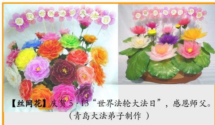
【丝网花】庆贺 5·13 “世界法轮大法日”，感恩师父。 (青岛大法弟子制作)

三妹夫这次去医院，是他自己骑摩托车去的。如今，三妹也修炼法轮大法了，夫妻俩都成为法轮大法好的活传媒。（文／云南大法弟子）◇