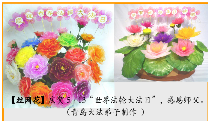
【丝网花】庆贺 5·13 “世界法轮大法日”，感恩师父。 (青岛大法弟子制作)

三妹夫这次去医院，是他自己骑摩托车去的。如今，三妹也修炼法轮大法了，夫妻俩都成为法轮大法好的活传媒。（文／云南大法弟子）◇