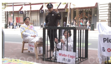
旧金山法轮功学员反迫害酷刑展

地址：江西省南昌市新建县长征西路 639 号 903 信箱第五监区，邮编：330100 监狱电话：0791-83711441