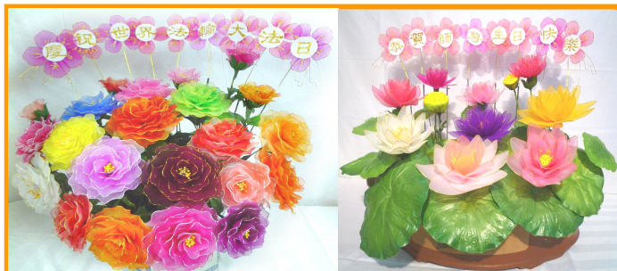
【丝网花】庆贺5·13“世界法轮大法日”，感恩师父。 (青岛大法弟子制作)

三妹夫这次去医院，是他自己骑摩托车去的。如今，三妹也修炼法轮大法了，夫妻俩都成为法轮大法好的活传媒。（文／云南大法弟子）◇