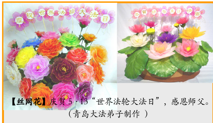
【丝网花】庆贺 5·13 “世界法轮大法日”，感恩师父。 (青岛大法弟子制作)

三妹夫这次去医院，是他自己骑摩托车去的。如今，三妹也修炼法轮大法了，夫妻俩都成为法轮大法好的活传媒。（文／云南大法弟子）◇