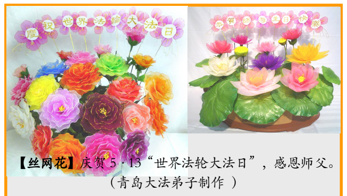
【丝网花】庆贺 5·13 “世界法轮大法日”，感恩师父。 (青岛大法弟子制作)

三妹夫这次去医院，是他自己骑摩托车去的。如今，三妹也修炼法轮大法了，夫妻俩都成为法轮大法好的活传媒。（文／云南大法弟子）◇