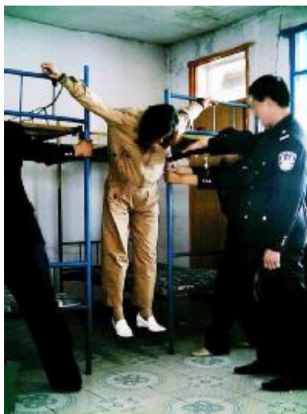
中共酷刑演示:悬空吊起

中共检察院、法院,为迫害法轮功学员达到诬判目的,千方百计刁难、打压律师,阻止正当辩护。例如吉林市警察在二零一三年十月十七至十八日绑架了三十多位法轮功学员,图谋对部份法轮功学员判刑。学员的家属们共计聘请了十二位维权