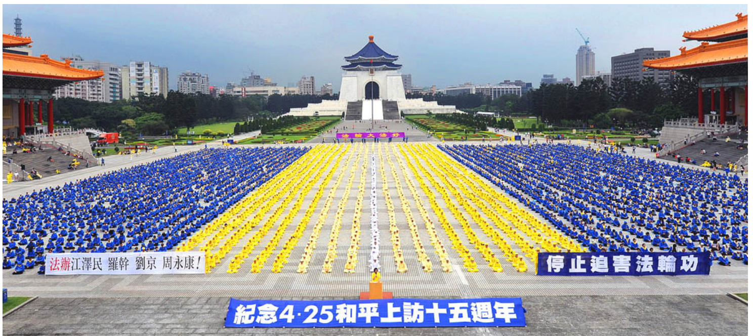
2014 年 4 月 26 日，近 6000 名法轮功学员在台北自由广场纪念“4·25”和平上访 15 周年，呼吁制止中共迫害，法办迫害元凶。