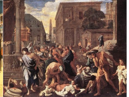
图 1：《基督殉道者最后的祈祷》，描述了罗马帝国残酷镇压基督教徒的情景：竞技场周围的柱子上，左边是遭受火刑的基督徒，右边是钉死在十字架上的基督徒，中间的一群基督徒，在被猛兽撕碎前祈祷。图 2：画家描绘的瘟疫（1630 年，法国画家 Nicolas Poussin）

即位，那时庞大的罗马帝国已危机重重。为转移危机，他挑起了一次全国性的空前迫害，他下诏，以法律的形式规定人人都必须去拜祭罗马的神像和罗马帝王像，以得到一张政府的证明，没有这个身份证明，就会被处死。次年，瘟疫再次降临。这场瘟疫因基督教的一位主教西普里安（Cyprian）的记载，而被称为西普里安瘟疫。德修即位 2 年即战死，而这场瘟疫猖獗了近 20 年，夺去了 2500 万人的生命，是历史上死亡人数最多的瘟疫之一。在高峰期罗马城每天死 5000 人，军队战斗力大减。270 年，帝王克劳狄二世也死于瘟疫。