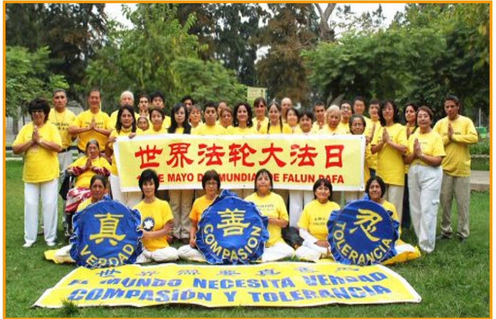
图：秘鲁法轮功学员恭祝师尊生日快乐

法轮大法也称法轮功，由李洪志先生于一九九二年五月传出，以宇宙最高特性“真善忍”为根本指导，按照宇宙演化原理而修炼。至今，世界