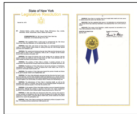
纽约州立法决议案

鉴于，法轮大法自 1996 年传入纽约，数以百计的修炼者在大纽约地区的老人中心、公司、健身房、私人住家和警察局等地举办过多个免费