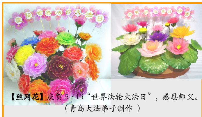
【丝网花】庆贺5·13“世界法轮大法日”，感恩师父。 (青岛大法弟子制作)

三妹夫这次去医院，是他自己骑摩托车去的。如今，三妹也修炼法轮大法了，夫妻俩都成为法轮大法好的活传媒。（文／云南大法弟子）◇