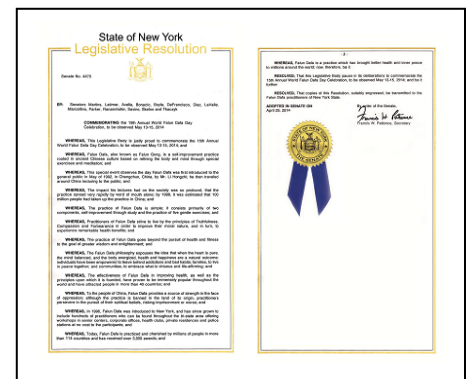
纽约州立法决议案

鉴于，法轮大法自 1996 年传入纽约，数以百计的修炼者在大纽约地区的老人中心、公司、健身房、私人住家和警察局等地举办过多个免费