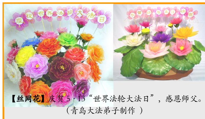
【丝网花】庆贺 5·13 “世界法轮大法日”，感恩师父。 (青岛大法弟子制作)

三妹夫这次去医院，是他自己骑摩托车去的。如今，三妹也修炼法轮大法了，夫妻俩都成为法轮大法好的活传媒。（文／云南大法弟子）◇