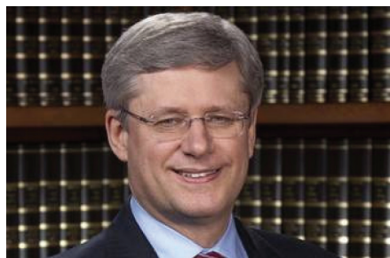
캐나다 총리 스티븐 하퍼와 축하서신

2006년부터 매년 5월이 되면 캐나다 스티븐 하퍼 총리는 ‘파룬따파의 날’을 기념해 축하서신을 보내왔다. 하퍼 총리는 금년의 축하서신에서 “전 세계 수백