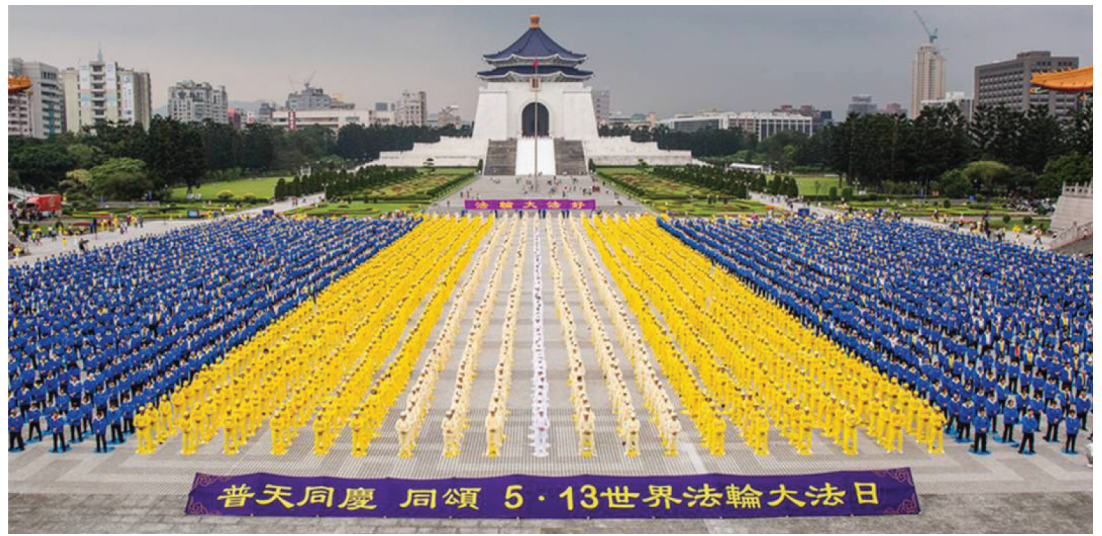
4월 26일, '5.13 세계 대법의 날'을 기념해 타이완 파룬궁수련생 6천명이 연공하고 있다