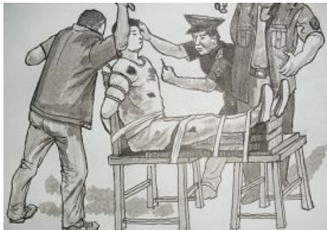
中共酷刑:老虎凳(绘画)

大抓捕中至少有五万法轮功学员被关押,十五人被非法判刑四至二十年,至少八人被虐致死。无数的男女法轮功学员被施以老虎凳酷刑。