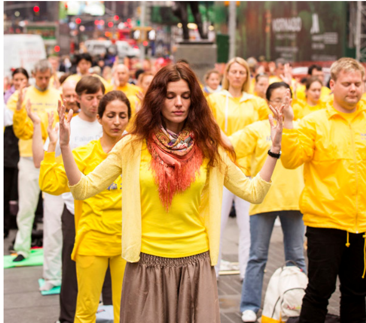
2014 年 5 月 15 日,西人法轮功学员在纽约时代广场集体炼功。

5 月 13 日是“世界法轮大法日”,也是法轮功创始人李洪志先生的华诞。2014 年的 5 月 13 日是法轮大法弘传世界 22 周年。值此,众多北美城市颁发褒奖