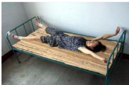
酷刑演示：铐在床上

到后来，我身体完全失去了知觉，可心里是明白的。一个“陪员”说：你这样死了，共产党会说你是自杀的，还是吃饭吧，写了东西回家，想怎么炼，就怎么炼。他这话倒提醒了我，因为这是恶党惯用的手段。那时，我呼吸都很困难，我用尽最大的力气喊：“我如果出了什么事，绝不是我自己所为，一定是他人所为。”