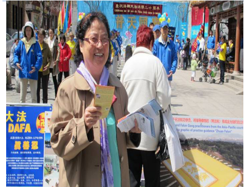
사진: 몬트리올에서 파룬따파 세계 홍전 20주년경축, 70 여세인 김여사는 진상자료를 배포하고 있다.

김여사는 교통사고 후유증 두통 때문에 진통제를 너무 먹어 위벽이 뚫어졌다. 후에는 요추 추간판 탈출증과 골질증식 등 병으로 인해 대부분 시간은 병원에 가 약을 쓰는데다 보냈다. 그녀는 "파룬궁을 수련해 두 달 후 허리가 아프고 다리와 발이 령할하지 못하던 증상이 없어 졌고, 생각밖에 두통