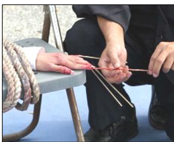
酷刑演示：竹签钉指甲