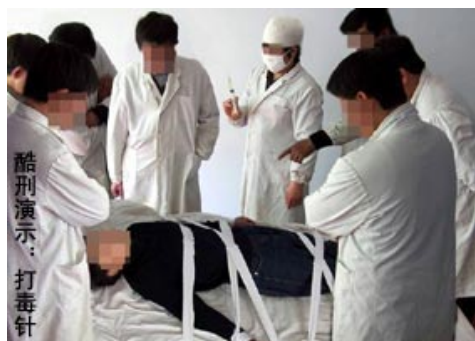
酷刑演示：打毒针（注射破坏神经中枢的药物）

在上述卑鄙伎俩中，最为残忍的是，“610”、警察操纵精神病院医务人员、或亲自动手，用破坏神经中枢的药物，对法轮功学员进行折磨和身心摧残。“610 办公室”是中共为了迫害法轮功而成立的凌驾于法律