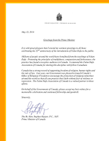
加拿大总理斯蒂文·哈珀和斯蒂文·哈珀的贺信