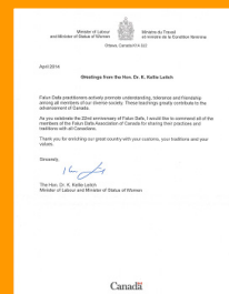
多元文化国务部长蒂姆·厄普尔、国家税务部长克里·林恩·芬德利（Kerry-Lynne D. Findlay）、劳工部长凯利·利奇（K. Kellie Leitch）的贺信

月里，我很高兴地对法轮大法学会，以及加拿大所有的法轮大法修炼者致以最美好的祝愿。