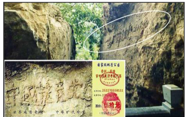
图为巨石“藏字石”的断裂面和风景区的门票

《九评共产党》一书真实深刻地揭露了中共谎言和暴政,已在中国促成史无前例的强大的退出中共恶党的精神觉醒运动,至2014年4月,已有超过一亿六千四百万中国人顺应天意,声明“三退”(退出党、团、队)。朋友,你退了吗?