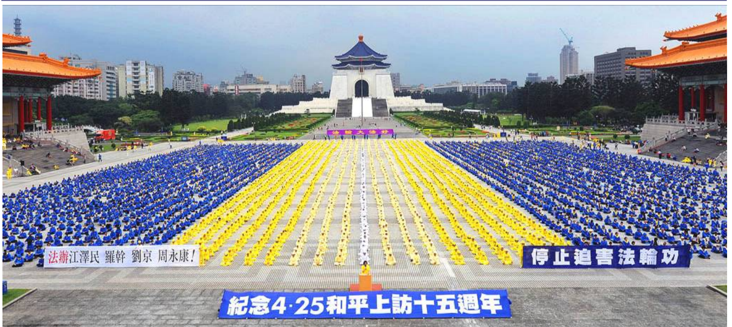
2014年4月26日，近6000名法轮功学员在台北自由广场纪念“4·25”和平上访15周年，呼吁制止中共迫害，法办迫害元凶。