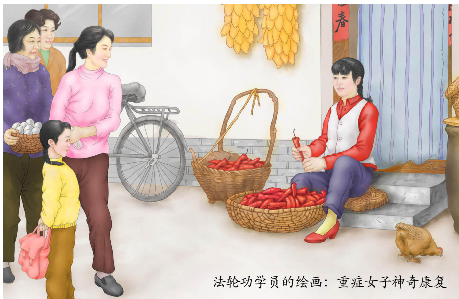
法轮功学员的绘画：重症女子神奇康复