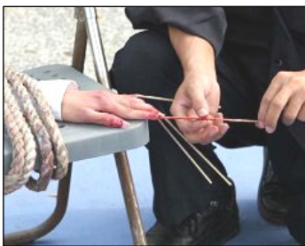
酷刑演示: 竹签钉指甲