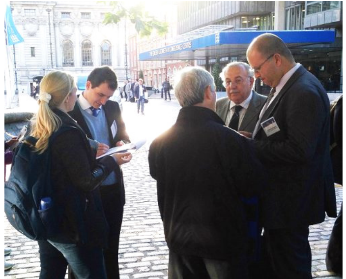
三位巴西医生在认真了解真相后, 在反强摘征签表上签名

两位来自美国的女医生表示听说过中共活摘器官的事情, 她们在征签表上签字, 要求结束暴行。其中一位边签边表达自己的见解, 认为中国医生同行能在短短几年内一人做几千例器官移植手术, 对于她们