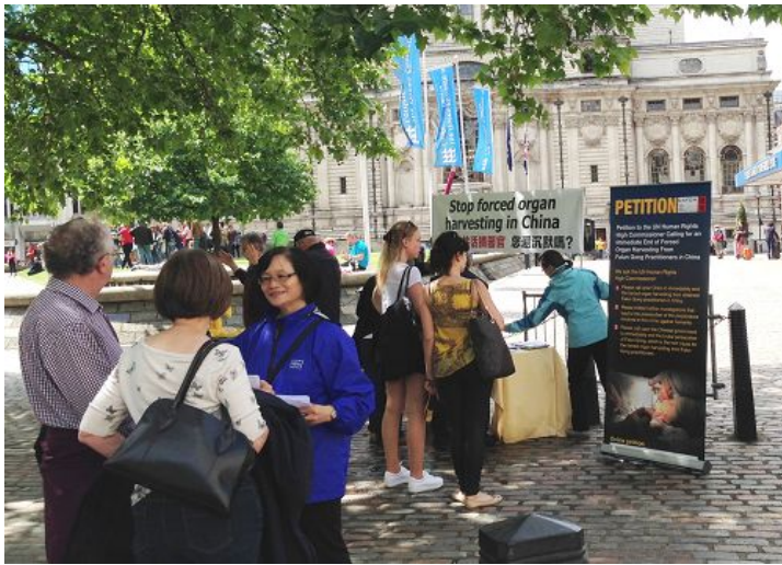
法轮功学员在伦敦伊丽莎白二世会议中心外面炼功、讲真相、进行反活摘器官征签