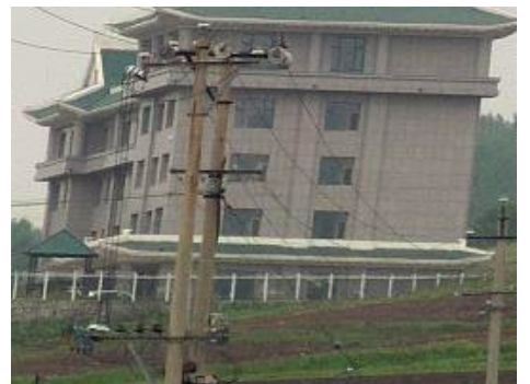
延吉市依兰镇石岘村救助站洗脑班

洗脑班是中共另一个私设的法外黑狱，劳教所的所有罪恶它几乎全部都有，甚至有过之而无不及。采用的精神控制和强行灌输等方式，从行为上已经构成了绑架和非法拘禁等罪行。中共使用洗脑班迫害法轮功学员，严重违反了人类道德良知，毫无道德底线可言。在良心、道义面前，洗脑班必须全面解体，中共迫害法轮功学员的罪恶必须全面清算！◇