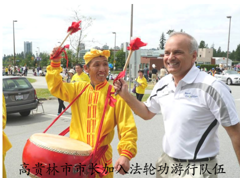
高贵林市市长加入法轮功游行队伍

【明慧网】2014 年 6 月 8 日, 加拿大温哥华法轮大法学员参加了高贵林市 (Coquitlam) “泰迪熊节”游行, 受到观众热烈欢迎。高贵林市