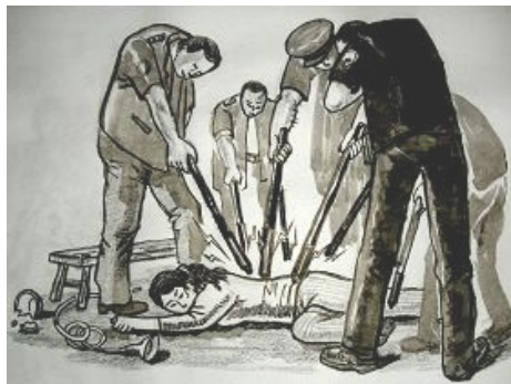
酷刑示意图：多根电棒电击