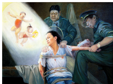
演示：打毒针（注射不明药物）（绘画）

在派出所姓魏和姓米（音）的警察负责迫害，抢走了我身上所带的所有真相资料和钱物，整理完黑材料后，对我一阵暴力殴打，并强制用玻璃划破皮肤采集血液标本。之后反复诱供，逼迫我签字画押，承认从未受过公安