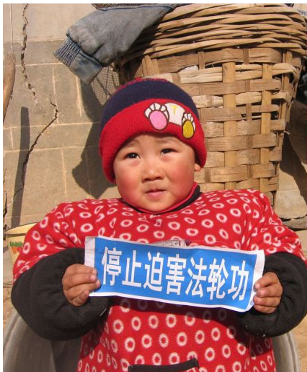
河北大法弟子摄影作品：心愿