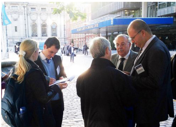
伦敦国际移植大会代表在会场外签名反对中共活摘器官的罪行。 右图: 中文资料《追查浙江省反邪教协会理事长郑树森参与迫害法轮功的通告》

信中说: “郑树森曾做过 1000 多例肝移植”, “从 1999 年以来中国的移植规模大幅增长, 郑树森实现的移植数量是这一增长的一部分。1991 年至 1998 年, 中国的肝移植数量是 78 例, 1999 年上升到 118 例, 其后这一数字开始几倍增长, 到 2005 年达到了 4000 例。相似的增长规律也发生在其它器官的移植上。可是, 同期器官捐献水平并没有发生相应变化。同时, 很多移植中心称它们可以在两周内找到合适的供体。”