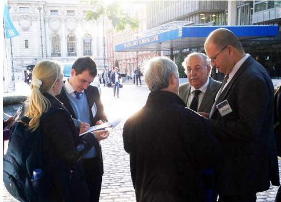
伦敦国际移植大会代表在会场外签名反对中共活摘器官的罪行。 右图: 中文资料《追查浙江省反邪教协会理事长郑树森参与迫害法轮功的通告》

信中说: “郑树森曾做过 1000 多例肝移植”, “从 1999 年以来中国的移植规模大幅增长, 郑树森实现的移植数量是这一增长的一部分。1991 年至 1998 年, 中国的肝移植数量是 78 例, 1999 年上升到 118 例, 其后这一数字开始几倍增长, 到 2005 年达到了 4000 例。相似的增长规律也发生在其它器官的移植上。可是, 同期器官捐献水平并没有发生相应变化。同时, 很多移植中心称它们可以在两周内找到合适的供体。”