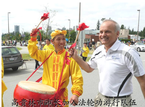
高贵林市市长加入法轮功游行队伍

【明慧网】2014 年 6 月 8 日, 加拿大温哥华法轮大法学员参加了高贵林市 (Coquitlam) “泰迪熊节”游行, 受到观众热烈欢迎。高贵林市