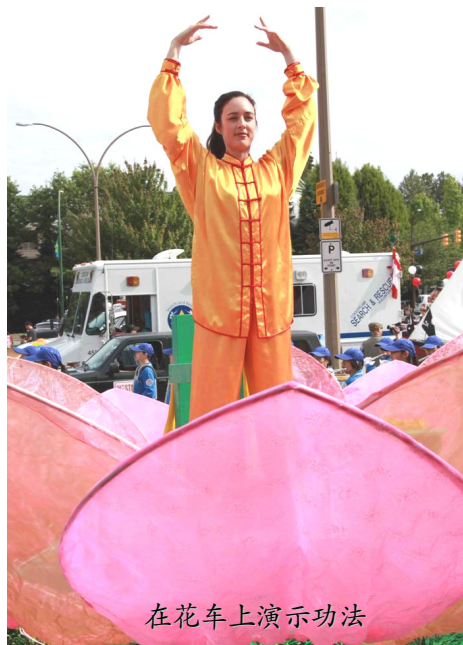
在花车上演示功法

【明慧网】2014 年 6 月 8 日, 加拿大温哥华法轮大法学员参加了高贵林市 (Coquitlam) “泰迪熊节”游行, 受到观众热烈欢迎。高贵林市