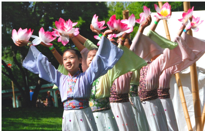
美国费城明慧学校的学生应邀在亚裔文化节上表演舞蹈

谎言教育。很多大陆小学在早上学生入校时，还见缝插针地播放所谓爱国（其实是爱党）歌曲，比如《共产主义接班人》、《五星红旗迎风飘扬》等等。