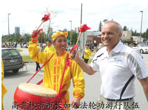
高贵林市市长加入法轮功游行队伍

【明慧网】2014 年 6 月 8 日, 加拿大温哥华法轮大法学员参加了高贵林市 (Coquitlam) “泰迪熊节”游行, 受到观众热烈欢迎。高贵林市