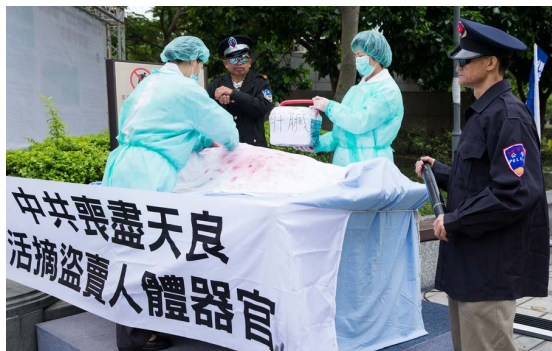
▲台湾学员模拟中共活摘法轮功学员器官

中共对法轮功的迫害，导致中国社会道德急速下滑。中共为了迫害以“真、善、忍”为根本信仰的法轮功，不惜宣扬假恶暴、色情等败坏人类的