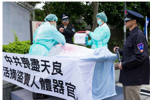
▲台湾学员模拟中共活摘法轮功学员器官

中共对法轮功的迫害，导致中国社会道德急速下滑。中共为了迫害以“真、善、忍”为根本信仰的法轮功，不惜宣扬假恶暴、色情